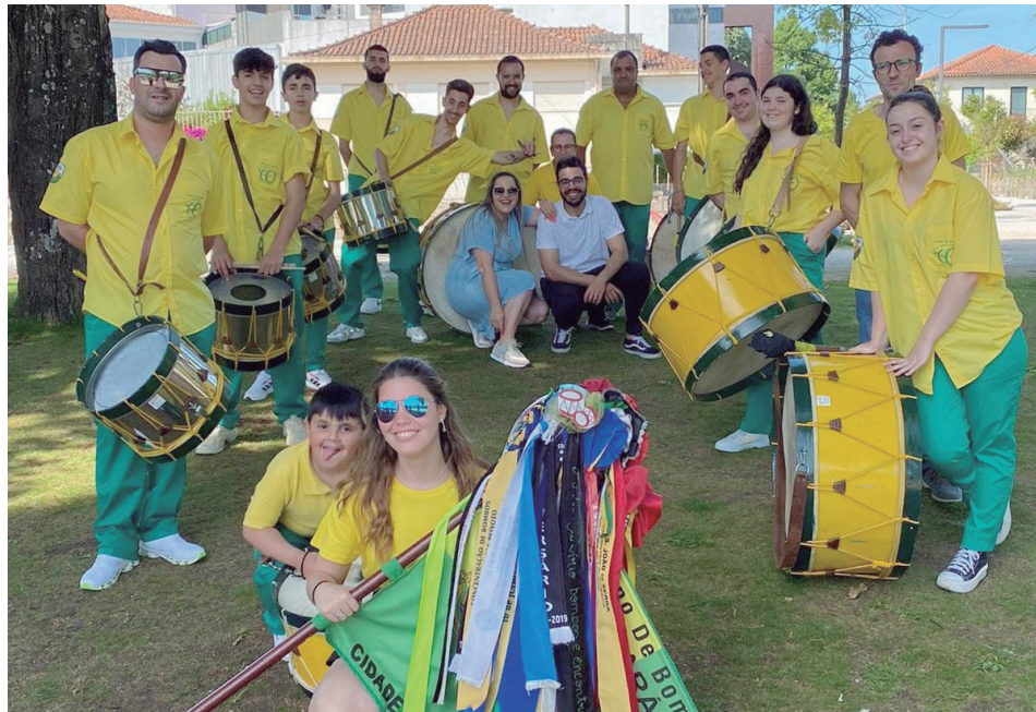
o palco para a inovação e aprimoramento constante.